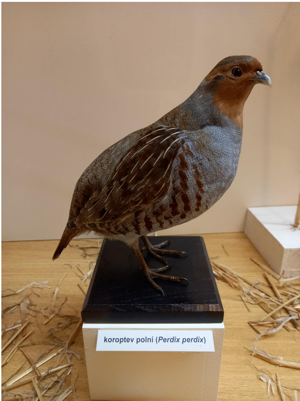
koropectv polní ( Perdix perdix )