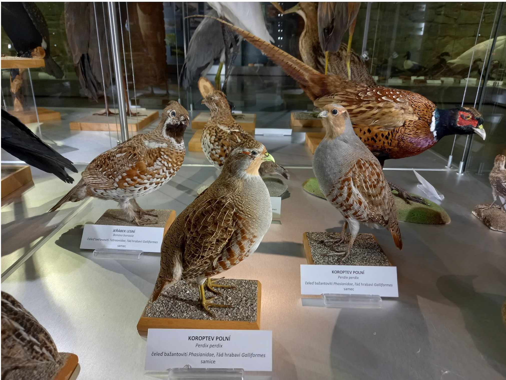
JERÁBEK LESNÍ Bonasa bonasia čeleď tetřevovití Tetraonidae, řád hrabaví Galliformes samec